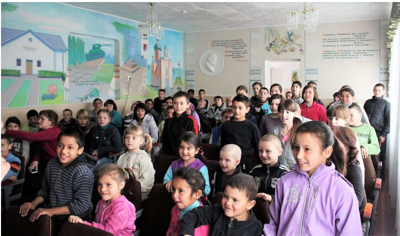
Beim letzten Besuch in Ivanychi ...

RT 0903 1100.12.2210 SC 2018_Spende. Bitte geben Sie Na-